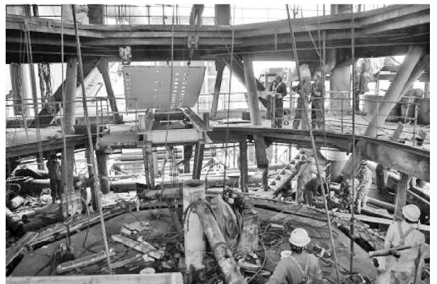
图 4 为运输通道的实例照片

③为了保证炉壳及冷却壁的顺利吊装,应设计好一条畅通的运输通道。在旧出铁场上铺设一条运输通道,上设一台运输小车,利用出铁场行车将保留带以下部分炉壳及冷却壁吊至小车上,运输至电葫芦下方进行安装。在炉身 20m 平台上铺设一条运输通道,上设一台运输小车,利用炉顶行车将保留带以上部分炉壳及冷却壁吊至小车上,运输至电葫芦下方进行安装。