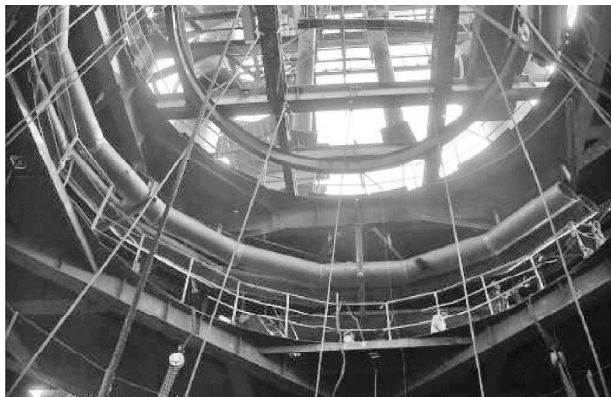
图 2 为井字梁、环轨、电葫芦设置的实例照片

③将制作好的井字梁在炉顶大平台大梁上拼装成整体,然后安装好环形单轨及两台 10t 电葫芦。调试合格即可正式进行炉壳及冷却壁的拆除工作。