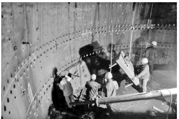
图 3 为吊装炉壳和冷却壁的实例照片

③为了保证炉壳及冷却壁的顺利吊装,应设计好一条畅通的运输通道。在旧出铁场上铺设一条运输通道,上设一台运输小车,利用出铁场行车将保留带以下部分炉壳及冷却壁吊至小车上,运输至电葫芦下方进行安装。在炉身 20m 平台上铺设一条运输通道,上设一台运输小车,利用炉顶行车将保留带以上部分炉壳及冷却壁吊至小车上,运输至电葫芦下方进行安装。